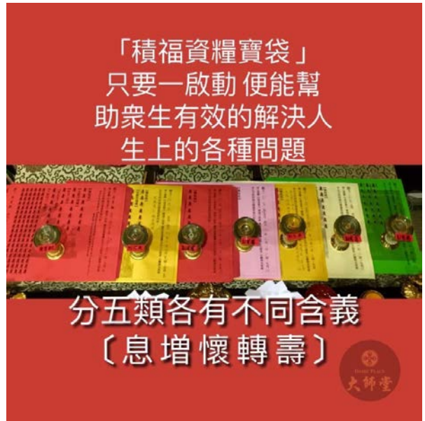
分五類各有不同含義 〔息增懷轉壽〕