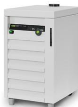
Recirculating Chiller F-305 / F-308 / F-314