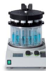
Multivapor™ P-6 / P-12