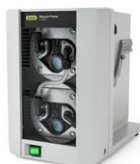
Vacuum Pump V-300