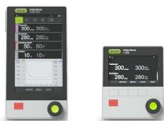
Interface I-300 / I-300 Pro