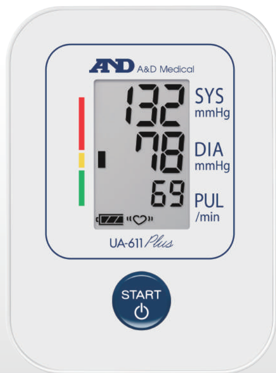
手臂式 電子血壓計

* 使用時請參照使用說明書 * Copyright © 杏豐實業股份有限公司, All Rights Reserved. * 本內容以官網公告為主，如有更改不另行通知，杏豐保留活動變更、終止之權利