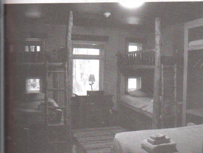
〉 住宿空間的設計詢問過學生的意見

Islandwood的主要收入來源為學生4天3夜的課程收費、企業領導統御課程及設施場地出租收入，還有募款所得。中心另設有500萬美元的獎學金基金，運用利息去補貼學童參與課程所需費用，並運用企業領導統御課程之盈餘，補助學校課程之虧損。Islandwood志工分為基礎之行政支援志工，以及進階的資深園區導覽志工。