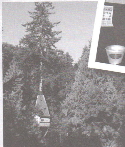
〉 小朋友喜歡的樹屋隱身在樹林裡