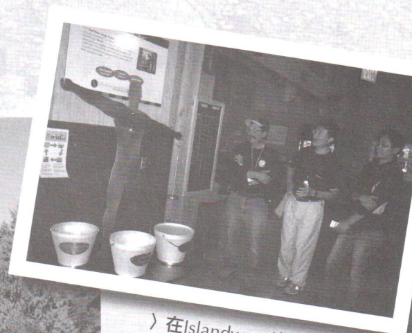
〉 在Islandwood的餐廳裡，吃不完的食物要秤重