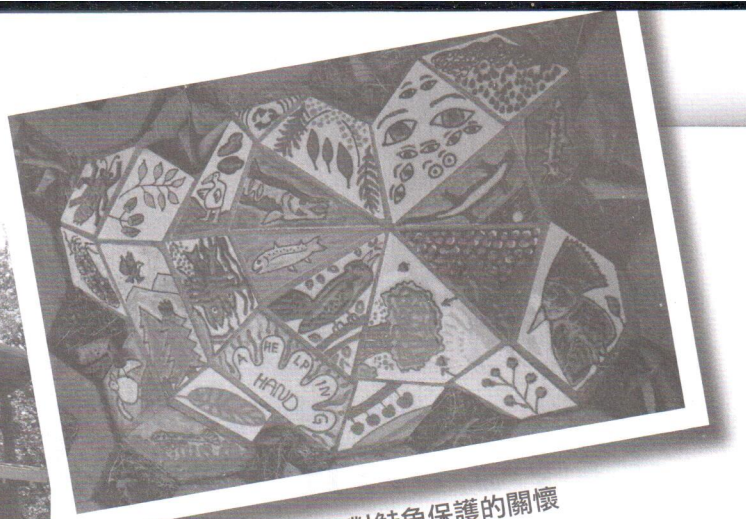
小朋友的作品裡也有對鮭魚保護的關懷