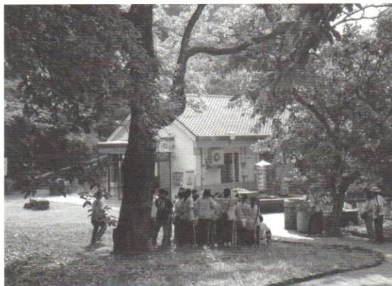
環境教育應融入學校教育各學科當中