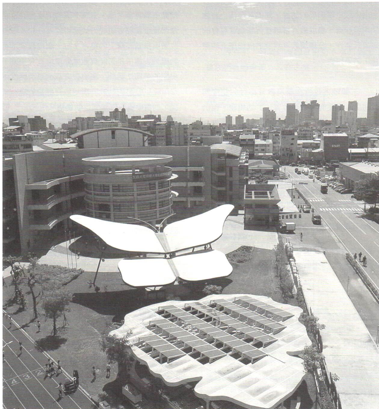
硬體設施也是一種環境教育