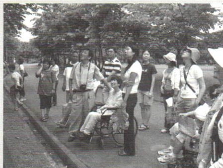
荒野因應不同的對象有不同的教學模式