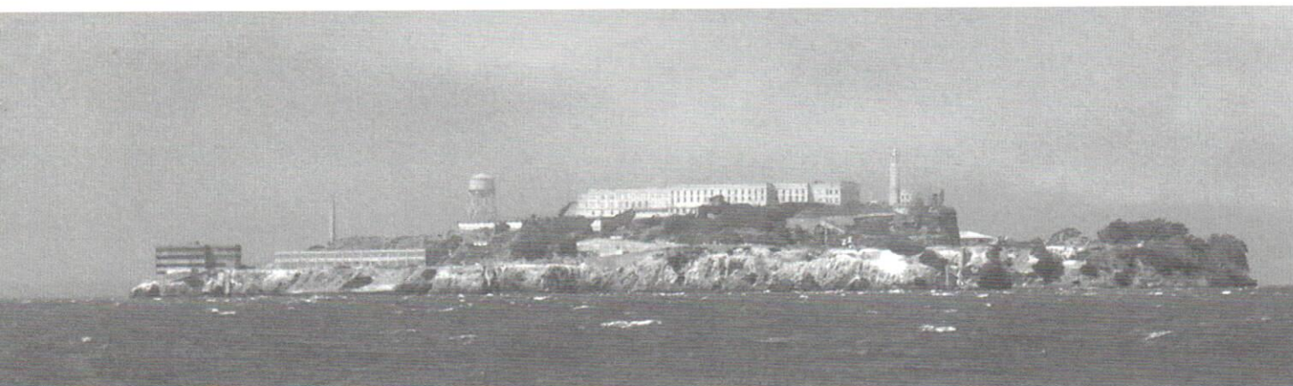
惡魔島 (Alcatraz Island) 四面峭壁深水，充滿神秘感。