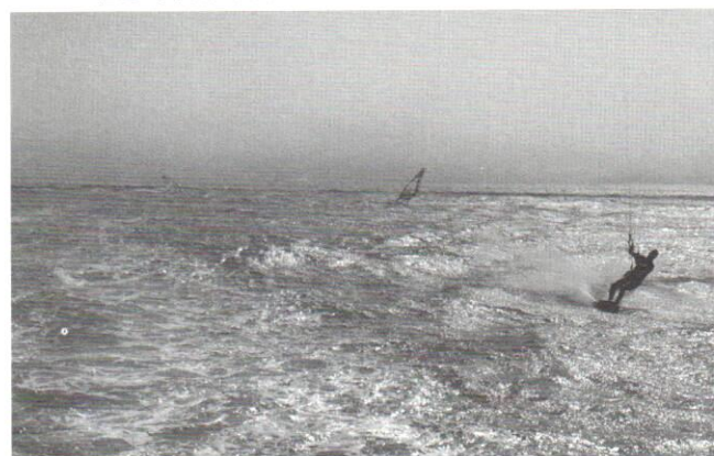
矗立在雲霧中的金門大橋，下方衝浪人士，在船邊呼嘯而過，驚險萬分。