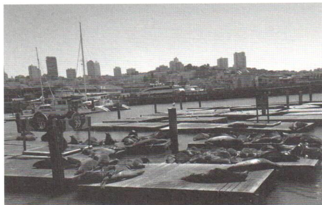
碼頭邊有許多從太平洋游來的海豹，慵懶的躺在甲板上，愜意的享受日光浴。

從博尼塔灣 (Bonita Cove) 回程 30 分鐘後，經過傳說中的惡魔島 (Alcatraz Island)，曾在歷史上是軍事碉堡及監禁最頑劣的罪犯。雖然此處距離舊金山灣區岸邊不遠，但由於長年海水冰冷，不曾有人成功逃獄。並因電影「絕地任務」(The Rock) 宣傳而聲名大噪，更增添神秘感。如今島上經過整理，發現許多認為已經滅絕了的玫瑰及原生植物，宛如與世隔絕的美麗小島。