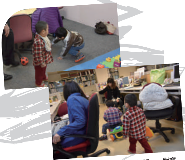
● 兩兄弟在辦公室大玩你追我跑，真是「哥倆好、一對寶」！

相信人們會為兄弟倆的新家獻上祝福，並為救世會的工作給予肯定。在新的一年，為了救援仍在陰影中等待幫助的孩子，為了鋪設孩子們的復原道路並為他們找到新家，懇切呼籲大家捐款支援我們的工作經費，別讓晚一步的動作，成為心中的遺憾。