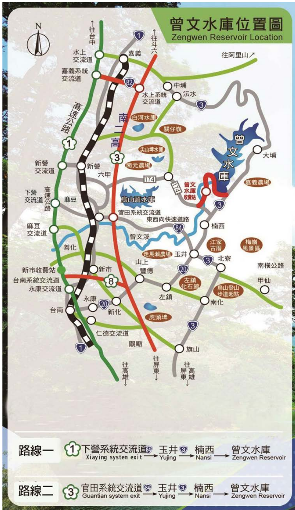
圖 2 曾文水庫聯外交通路線圖